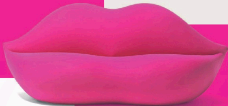
Neon-Pink Gufрамs berühmtes Lippensofa bringt Glamour ins Heim. gufрам.it architectu.com