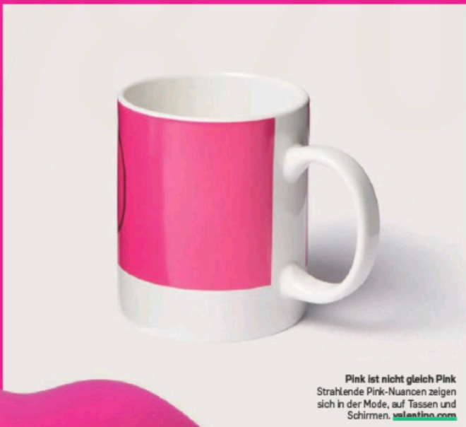
Pink ist nicht gleich Pink Strahlende Pink-Nuancen zeigen sich in der Mode, auf Tassen und Schirmen.