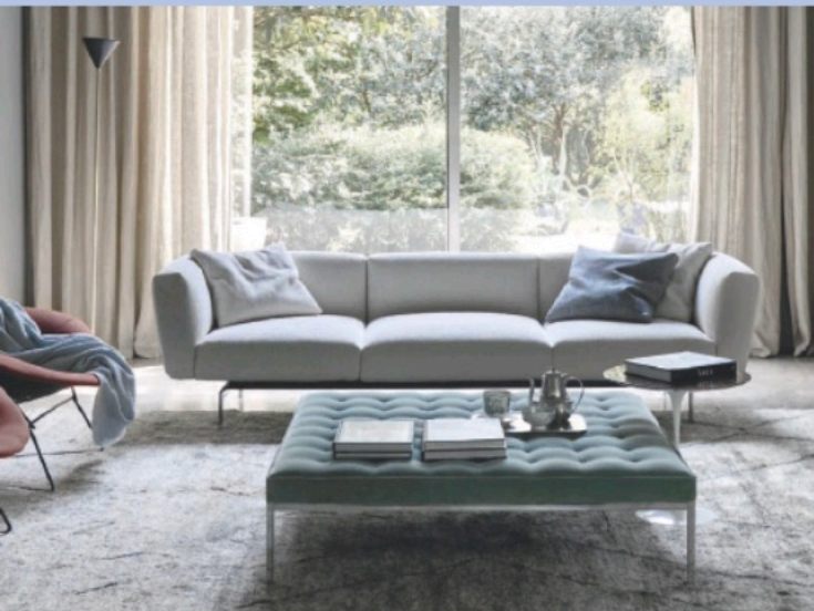
Flieg Taubengrauf Knoll schlägt beim Sofa »Avio« helle Graublau-Töne vor. knoll.com