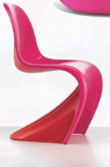
Duo in Pink Vitra produziert den »Panton-Chair« in verschiedenen Farbdios. Hier in Pink und Rot. vitra.com

Farbe mit. »Ich habe gerade erst damit begonnen, die Auswirkungen von Tageslicht und künstlichem Licht auf Farben und Oberflächenbeschaffenheit zu untersuchen.«