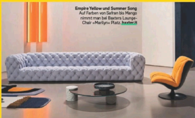
Empire Yellow und Summer Song Auf Farben von Safran bis Mango nimmt man bei Baxters Lounge- Chair »Marilyn« Platz. haxter.it

Dass Licht bei Farben eine wichtige Rolle spielt, untersuchte schon Verner Panton.